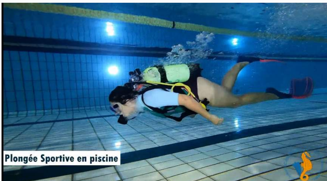
Plongée Sportive en piscine